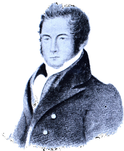
D. Juan Manuel de Rosas