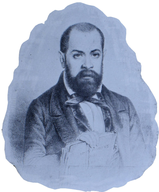
Sarmiento en Chile