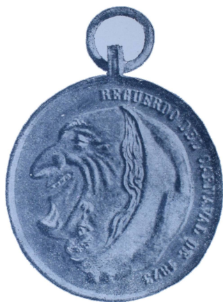
Reverso de la medalla burlesca