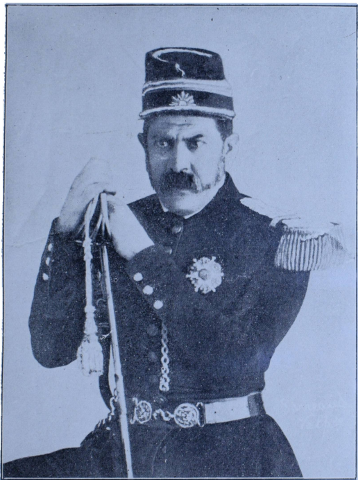
Comandante en Caseros