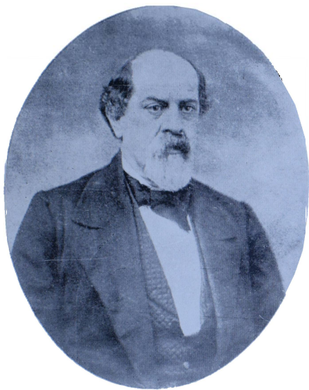
Gobernador de San Juan