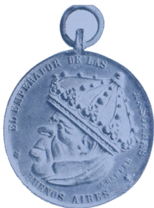
Medalla burlesca de Sarmiento (Págs. 50 y 219)